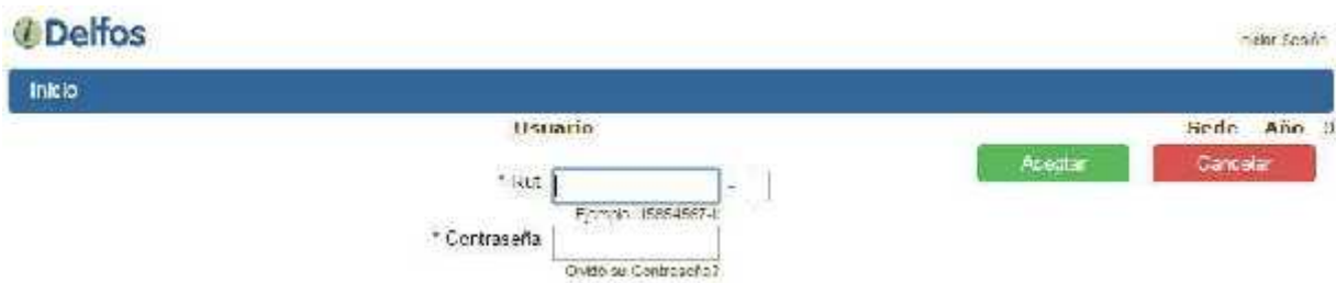
Figura N°1: Pantalla de ingreso al Sistema iDelfos.

2.- Alumnos antiguos: Utilizar Rut sin puntos y el digito verificador y la misma Contraseña del antiguo idelfos. Si no recuerda su clave enviar correo a ivan.quelin@ulagos.cl solicitando clave (indicando para ellos nombre y Rut).